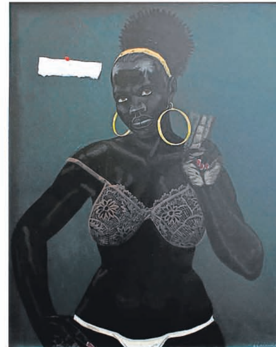
Kerry James Marshall Pintura y otras cosas FUNDACIÓ TÀPIES BARCELONA

presentaciones de Marshall no son violentas, pues, aún con un telón de fondo político y social definitivo, el campo de batalla donde el artista opera es el de las imágenes que se generan desde el arte y la cultura visual. Una de sus motivaciones principales es la belleza. Los cánones occidentales han creado una imagen de mundo que privilegia a los blancos como ideales heroicos y de perfección. La propia Historia del arte se rige por hitos en los que los negros sólo han asomado de forma soslayada (el tribalismo de algunas vanguardias), pero nunca siendo protagonistas. Marshall quiere demostrar no sólo